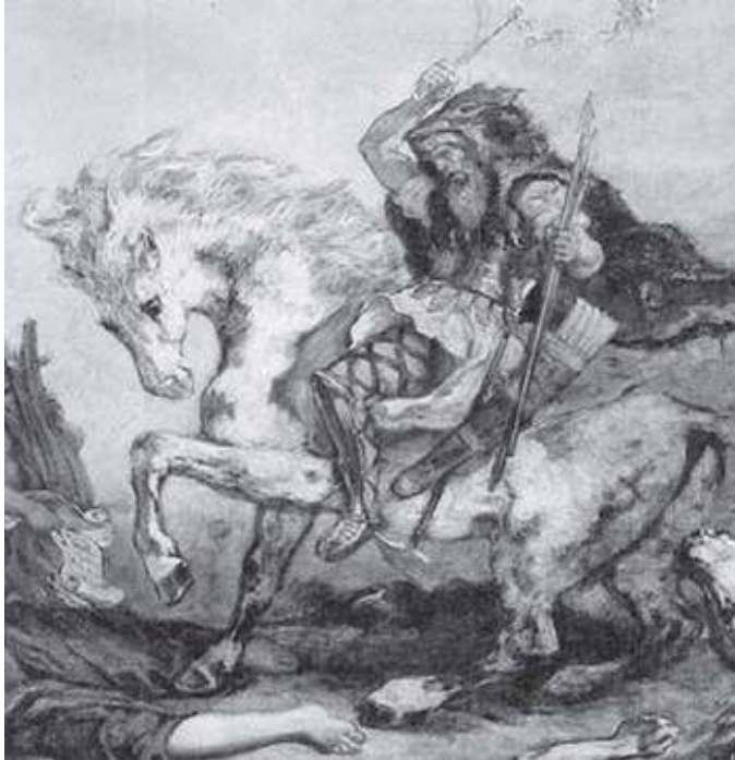
Átila, chefe dos hunos (434-453) (Fonte: Revista L' Histoire, n. 327, janeiro de 2008, p. 62).

Os hunos costumam ser conhecidos pelo seu rei Átila, chamado de o “flagelo dos deuses”. O depoimento abaixo sobre o aspecto e os costumes reforça a imagem de um povo rude e violento.