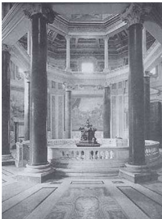
Batistério da Igreja de São João de Latrão, em Roma, datado da época do imperador Constantino (Fonte: Ramos, Luciano. Os Reinos Bárbaros - São Paulo: Ática, 1993. p. 30).

Iniciaremos o presente capítulo revendo algumas questões relacionadas à crise do Império, com o propósito de acompanhar as transformações que se seguiram à ruína do mesmo, especialmente da sua parte ocidental. Com esse assunto iniciamos o estudo da chamada Alta Idade Média, período marcado primeiro pela regressão no que diz respeito à organização política e ao domínio cultural dos romanos, à qual se segue o aparecimento das condições para o crescimento que vai orientar a formação de um mundo novo.