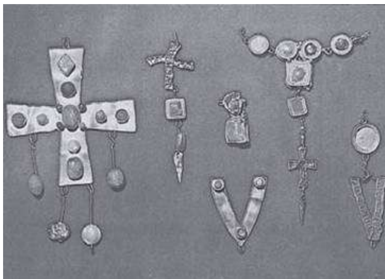
Jóias produzidas por ourives visigodos (Ramos, Luciano. Os Reinos Bárbaros. São Paulo: Ática, 1993. p. 31).

Mesmo considerando essa tendência dos estudiosos, a de privilegiar a aculturação como um dos desdobramentos da ruína do Império Romano do Ocidente, convém retomar a questão da continuidade ou ruptura da nova sociedade em relação à Antiguidade Clássica.